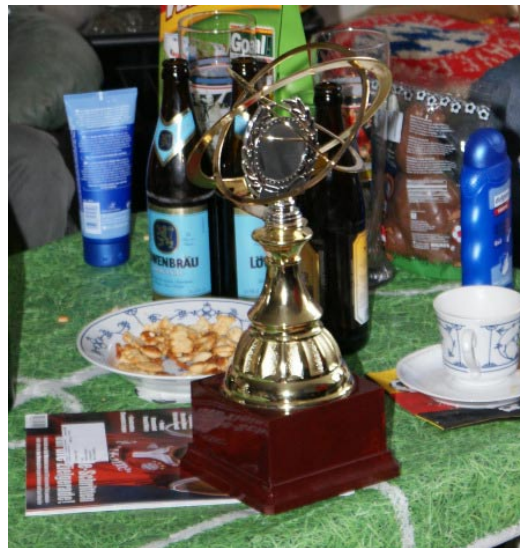
der neue Pokal und einige Preise

Kurzbericht von der Meisterfeier: Nach der Live-Übertragung der Spiele im sky-TV wurden die Preise verteilt, wobei sich der Sieger telefonisch zuschaltete. Was er dabei aber noch nicht mitbekam, war die zweite Überraschung des Nachmittags: der neue BL-Tipp-Pokal